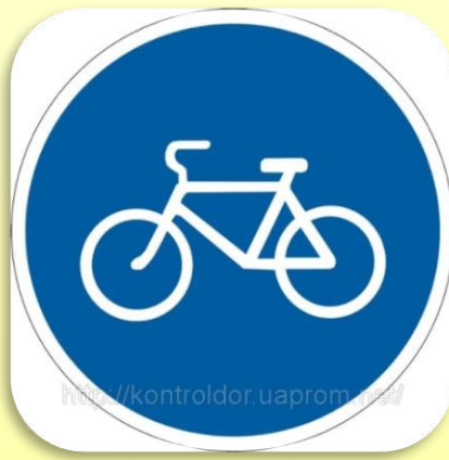
Разрешающий знак «Велосипедная дорожка»