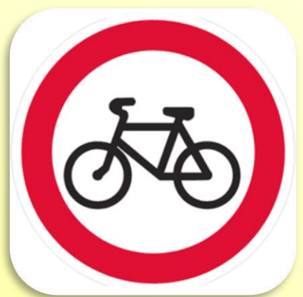
«Движение на велосипедах запрещено»

ЕСТЬ У МЕНЯ ВЕЛОСИПЕД, НО НЕТ ЧЕТЫРНАДЦАТИ ЛЕТ. ПОКА КАТАЮСЬ ВО ДВОРЕ, ГДЕ БЕЗОПАСНО ДЕТВОРЕ.