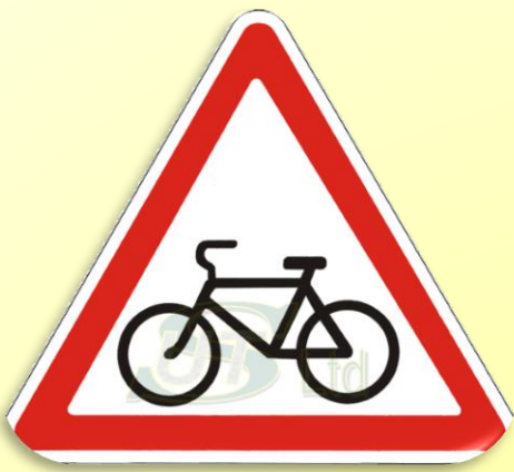
Предупреждающий знак «Выезд велосипедистов»